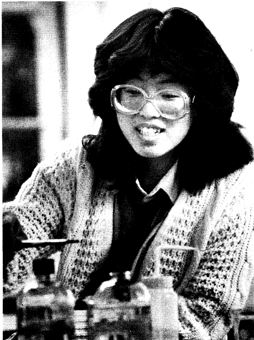
Department de Relations Publiques Pacific Union College

La validité de toute théorie ou modèle scientifique dépend du résultat des expériences qui exigent l'apparition et l'observation de phénomènes répétés. A cette jonction, les créationnistes et les