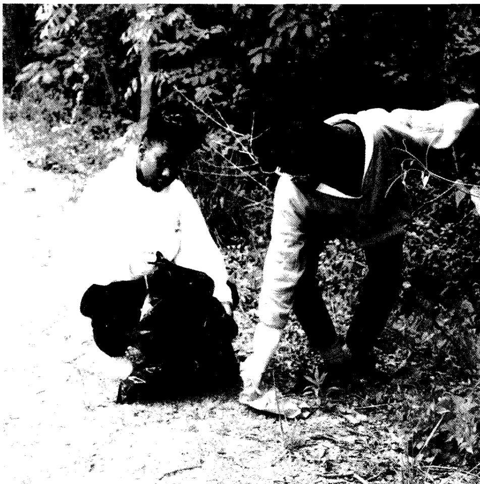
Des étudiants d'Oakwood College (Huntsville, Alabama) débarrassent pour la communauté huit kilomètres de route.

J'ai souvent fait remarquer à d'autres intellectuels qui mettaient en question la valeur de leurs racines adventistes, que les personnages qui avaient influencé le plus profondément la conscience du monde ces cinquante dernières années, provenaient souvent de minorités religieuses et même sectaires. Martin Luther King, Jr., un pasteur noir de l'Eglise baptiste du Sud ; Mère Teresa, une catholique de l'Albanie ; Alexandre Soljenitsyne, un écrivain russe orthodoxe exilé, et Elie Wiesel, un juif du ghetto européen. Qui aurait pu prédire le pouvoir moral de l'hindou Mahatma Gandhi ? Tous avaient été capables de transcender le fondamentalisme étroit de leurs communautés de foi tout en y puisant des forces morales et spirituelles. Et tout ceci a eu lieu bien qu'ils ne puissent pas prévoir à l'avance s'ils seraient soutenus par leur communauté de foi dans leur service pour le monde. 9