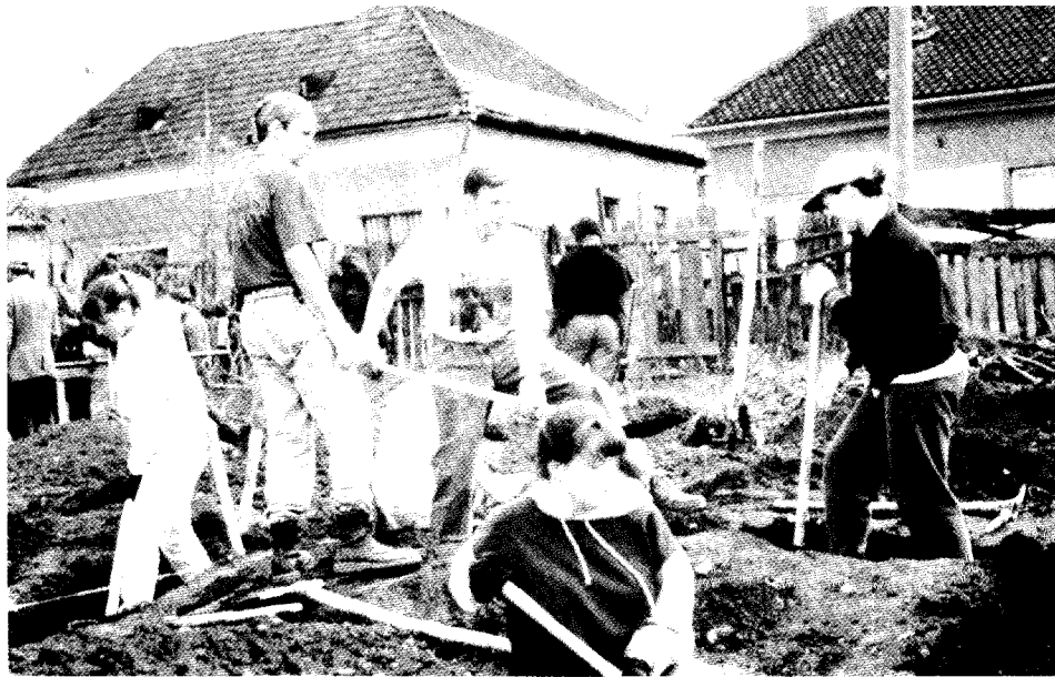
Des étudiants de Southwestern Adventist University (Keene, Texas) creusent les tranchées pour les fondations d'une église à Brassov, Roumanie.

apprendre avec encore plus d'efficacité.