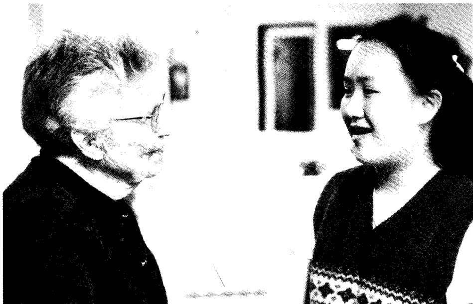
Des étudiants de Walla Walla College (College Place, Washington) passent le samedi après-midi à chanter pour les pensionnaires de maisons de retraite et à leur parler.

C'est un tort de laisser nos étudiants se morfondre dans la pensée qu'ils sont impuissants. « Tout être humain, créé à l'image de Dieu, a reçu une puissance qui ressemble à celle du Créateur : l'individualité, qui lui permet de penser et d'agir. » 5