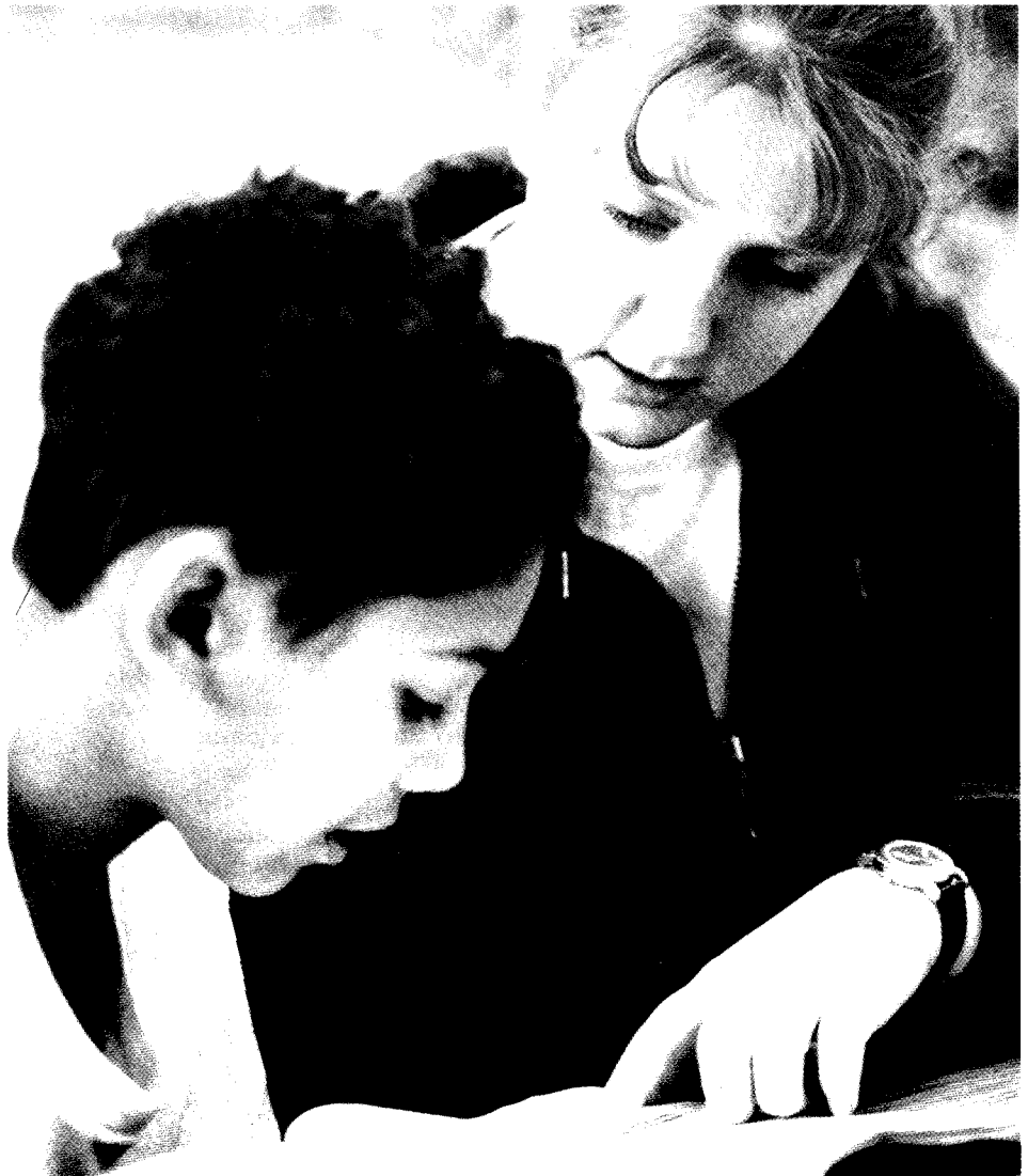
Une étudiante de Walla Walla College (College Place, Washington) aide un élève d'école primaire à faire ses devoirs.

Une synthèse plus satisfaisante consisterait à reconnaître que la fonction première d'une école