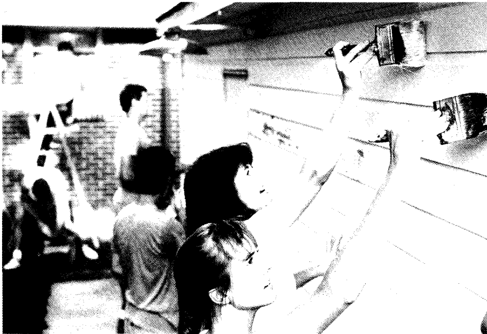
Chaque année, les étudiants d'Union College (Lincoln, Nebraska) peignent des maisons pour rendre service localement.