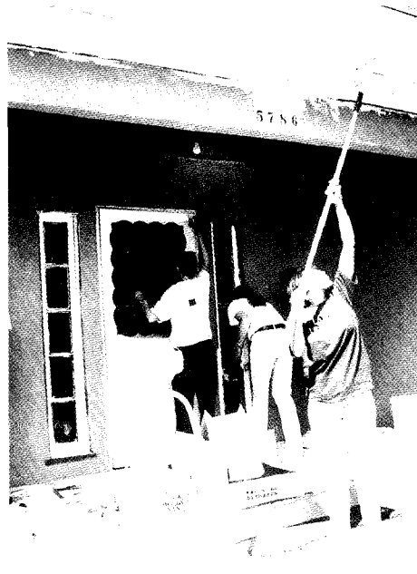
Des étudiants de La Sierra University (Riverside, Californie) repeignent des maisons durant une journée de service communautaire.

populaire auprès de nos étudiants qui sont intéressés au service. Certains de cette génération qui se méfient de l'activité intellectuelle et des institutions, sont souvent enclins à limiter leurs efforts à la soupe populaire. Mais il faut insister que les expériences concrètes doivent s'équilibrer d'une réflexion et d'un programme de lecture.