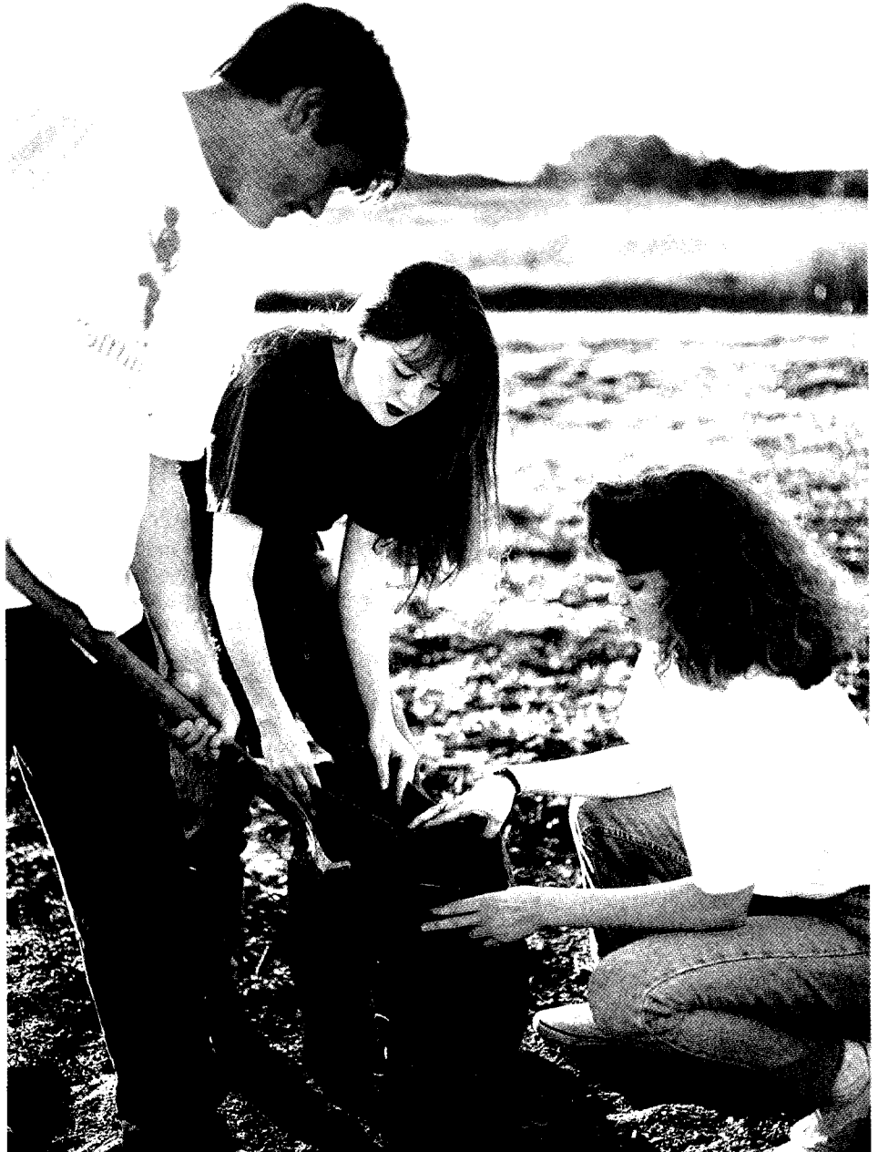
Le service à la communauté au Southern College of SDA (Collegedale, Tennessee) comprend le remplissage de sacs de sable pour combattre l'érosion.