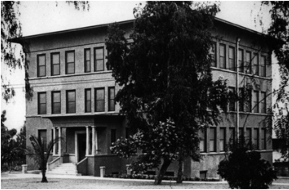
Construit par des étudiants en médecine, le premier bâtiment du College of Medical Evangelists à Loma Linda, en Californie, comprenait les bureaux administratifs pour le président, une salle des professeurs, une petite bibliothèque et des salles de classe.