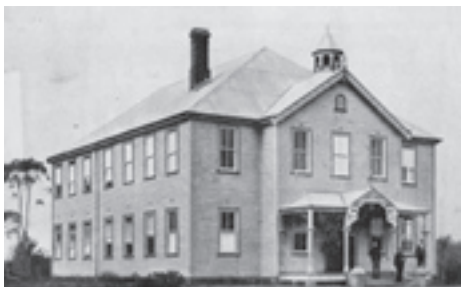
Ancienne photo d'Avondale College à Cooranbong, en Australie, fondé en 1897.