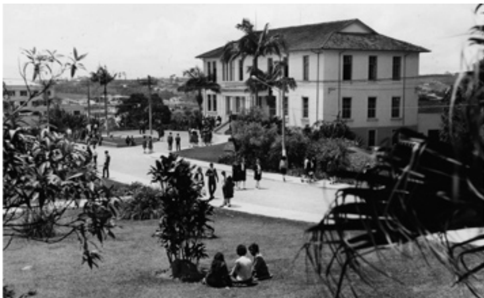
Le bâtiment administratif de Brazil College (à présent Brazil Adventist University) dans les années 1970.

1987 Le département de l'Éducation à la Conférence générale met sur pied l'Institute for Christian Teaching [institut