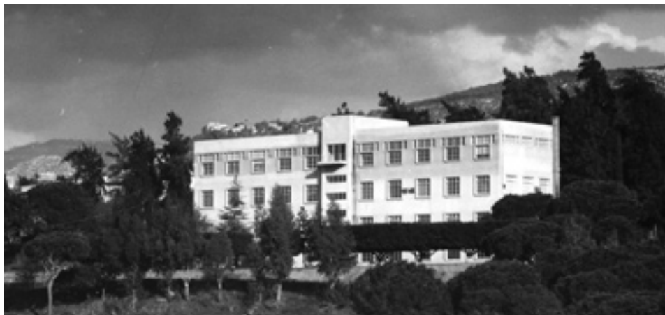
Middle East College, à présent Middle East University, à Beyrouth, au Liban, vers 1976.

1997 Le département de l'Éducation à la Conférence générale commence à con-