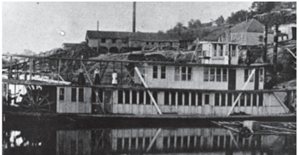
Le Morning Star sur lequel James Edson White établit la première école adventiste pour les Noirs américains en 1895.