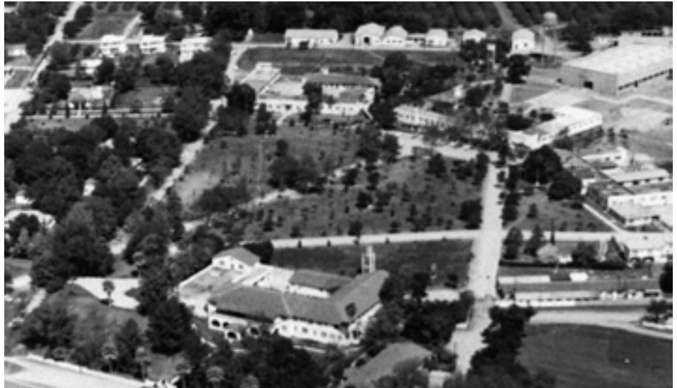
Campus de l'Universidad de Montemorelos, Mexique vers 1977