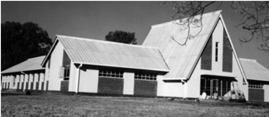
Bâtiment de la bibliothèque de Solusi College (aujourd'hui université) au Zimbabwe, dans les années 1970.