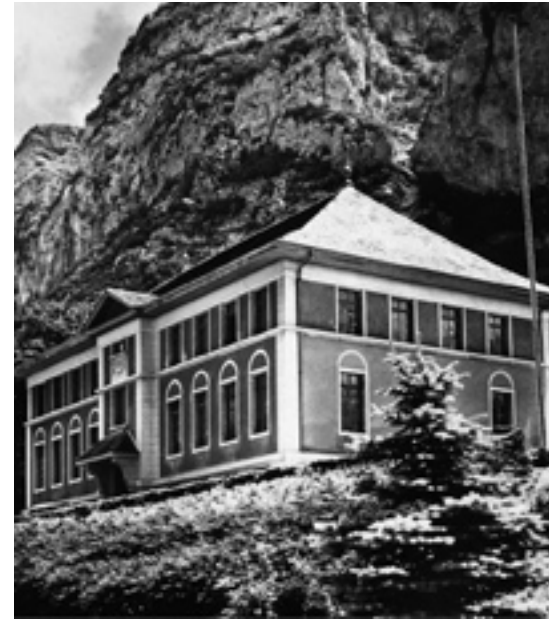
Le bâtiment administratif du Séminaire adventiste du Salève, en France, vers 1972.