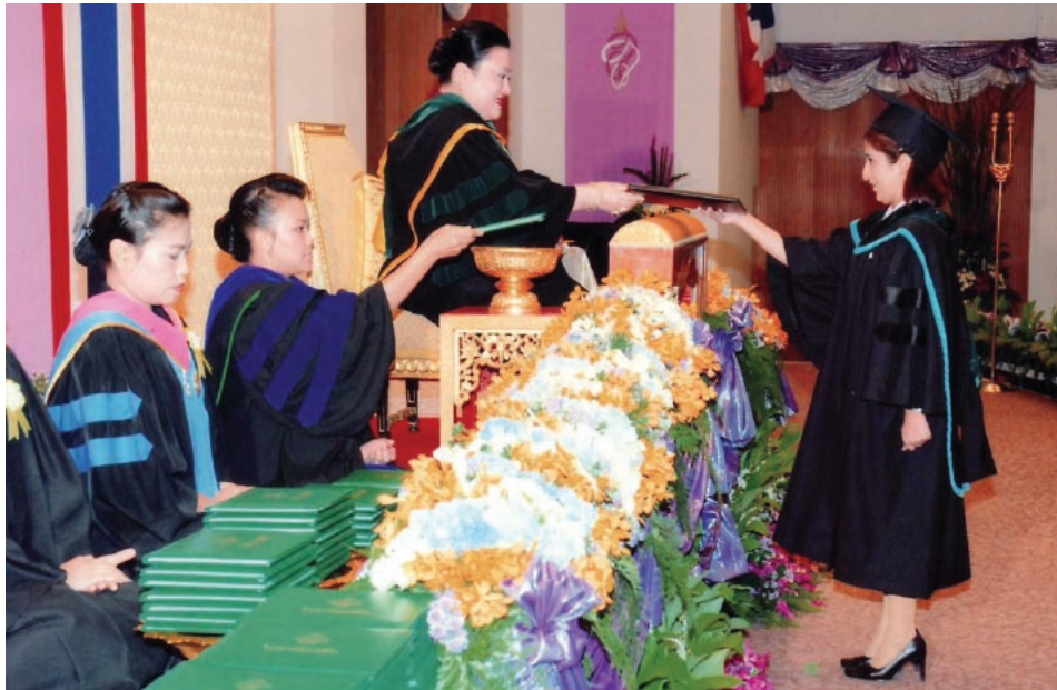
Une étudiante d'Asia-Pacific International University reçoit son diplôme de maîtrise des mains de la Princesse Soamsowalee

sont tombés d'accord pour finaliser, avant le comité consultatif de l'Éducation de la DAPS en 2011, le processus de planification stratégique entamé en 2008. En voici les principaux points : (1) focalisation spirituelle/morale ; (2) administration ; (3) marketing et promotion des inscriptions ; (4) programmes et instruction ; (5) équipements scolaires ; (6) finances et développement ; et (7) évaluation et révision continues. Dans le cadre de ce processus, nous avons organisé en août 2009, à l'échelle de deux unions d'Indonésie, une rencontre de consultation et de planification sur l'enseignement supérieur. De pa-