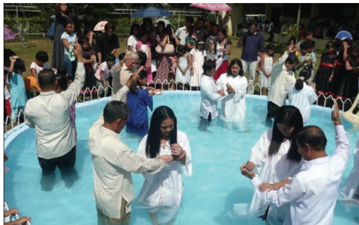
Baptêmes à l'école secondaire de Lipa, Philippines

Chaque année, les programmes d'évangélisation internes de la DAPS aboutissent à plus de 4 000 baptêmes. En outre, tous nos établissements prennent une part active aux programmes d'évangélisation dans les communautés voisines ou même dans des localités éloignées de nos campus. Le département de l'Éducation de la DAPS a alloué des fonds équivalents au budget de chaque université et du bureau de l'Éducation de chaque union pour élaborer et mettre en œuvre un plan d'application du concept d'évangélisation à partir des structures scolaires — concept intitulé « Dites-le au monde ! » Nos établissements secondaires et universitaires ainsi que les responsables éducatifs des différents niveaux (division, union, fédération/mission) tiennent tous chaque