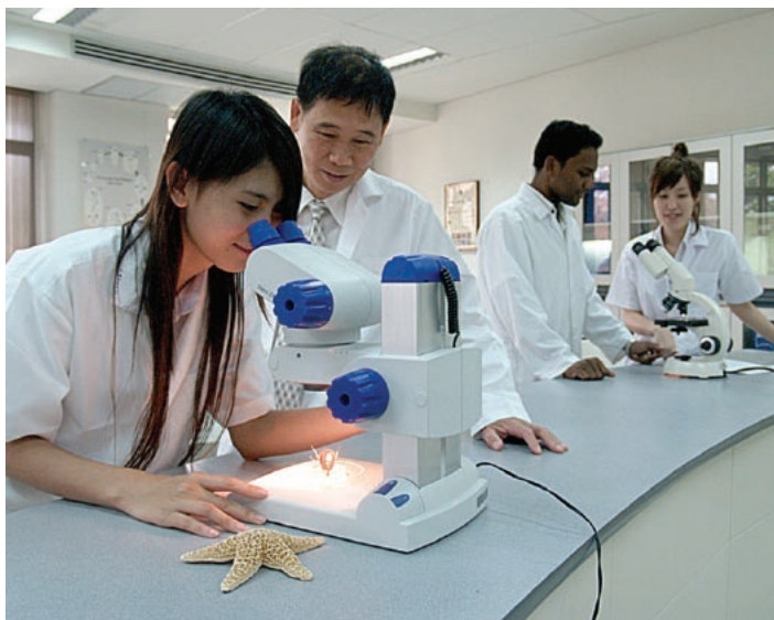
Étudiants en science au laboratoire d'Asia-Pacific International University

* Les programmes éducatifs de la DAPS fonctionnent dans les pays suivants : Bangladesh, Cambodge, Indonésie, Malaisie, Myanmar/Birmanie, Philippines, Singapour, Sri Lanka, Thaïlande, Timor-Leste (Timor oriental), territoires étatsuniens de Guam et de l'Île Wake, États fédérés de Micronésie, Îles Marshall, Îles Mariannes du Nord, République de Palau ; sauf : République démocratique populaire du Laos, République socialiste du Viêt Nam, Brunei Darussalam.