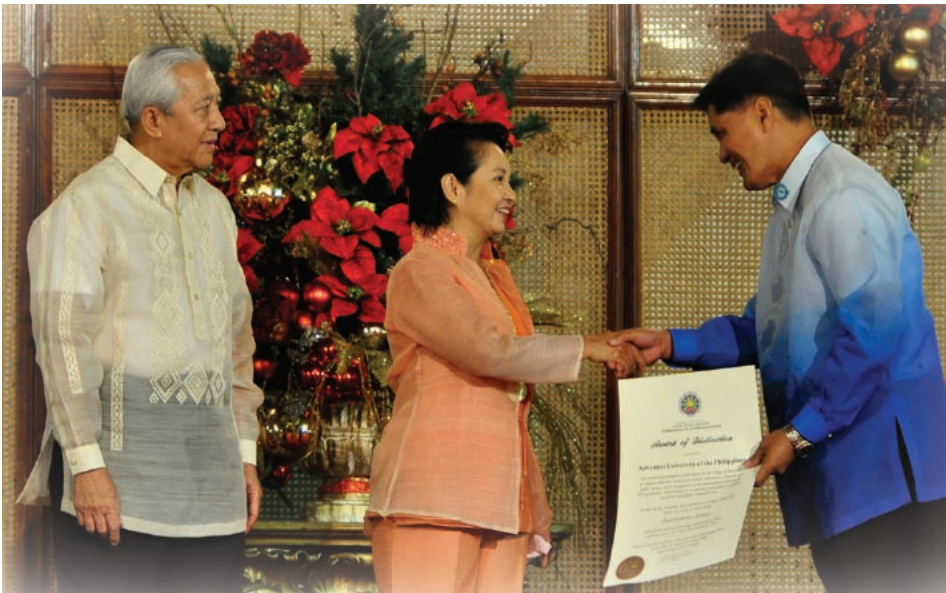
L'Université adventiste des Philippines, officiellement reconnue parmi les meilleures du pays

eux partager leur foi avec leur famille et leurs amis.