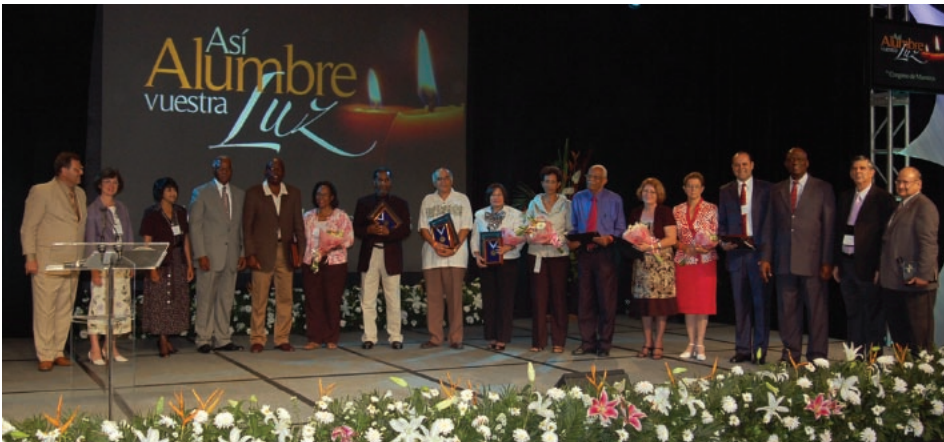
Premier congrès des enseignants de la Division interaméricaine, 2009