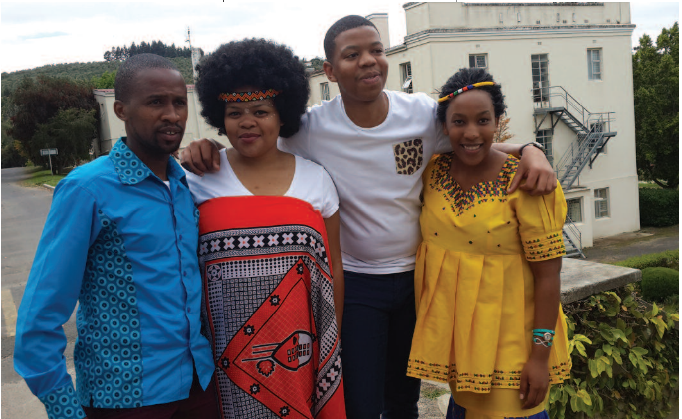
Célébration de la journée du patrimoine au Collège Helderberg, Afrique du Sud.

• Journée du patrimoine, Afrique du Sud. Le Collège Helderberg célèbre sa diversité chaque année le 24 septembre,