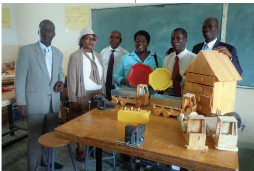
Assiettes en plastique et jouets en bois fabriqués par les étudiants du Collège Eastern Gate, au Botswana.

Cinq institutions tertiaires ont été évaluées par l'Association adventiste d'accréditation (AAA) avec les résultats suivants : le statut de candidat a été prolongé pour l'Université Rusangu en Zambie ; les institutions suivantes ont reçu l'accréditation régulière permanente jusqu'aux dates indiquées : l'Université Solusi au Zimbabwe (2016), l'Université adventiste Zurcher à Madagascar (2016) et le Collège tertiaire Helderberg en Afrique du Sud (2018).