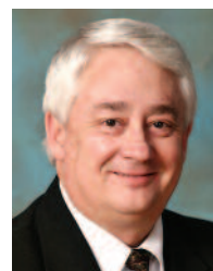
Larry Blackmer, Ed. D. , est vice-président de la Division nord-américaine de l'Église adventiste du septième jour à Silver Spring, Maryland, États-Unis.

nue en vue d'atteindre l'excellence dans l'instruction donnée aux élèves. Le processus d'accréditation présenté dans ce document fournit aux écoles de la division une structure solide et réfléchie sur les programmes et les pratiques, les méthodes d'amélioration en qualité, la poursuite de l'excellence et des meilleurs résultats possibles pour les élèves et leurs familles. Le cœur du cadre conceptuel de l'éducation adventiste présente les normes d'accréditation ou de certification dans le contexte de quatre balises : le but, le plan, la pratique et le produit. 🍃