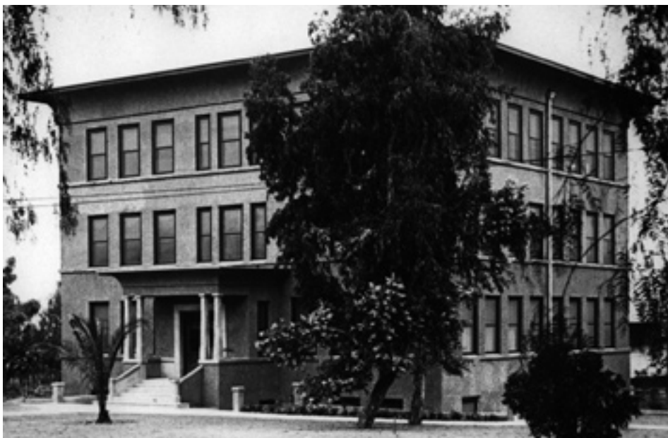
Construído pelos estudantes de medicina, o primeiro prédio da Faculdade de Medicina no College of Medical Evangelists em Loma Linda, Califórnia, o qual incluía sala administrativa para o diretor, sala de professores, uma pequena biblioteca e salas de aula.