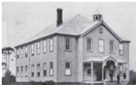
Uma das primeiras fotos do Avondale College, em Cooranbong, Austrália, estabelecido em 1897.

É aberta a Buresala Training School (precursora do Fulton College) em Fiji