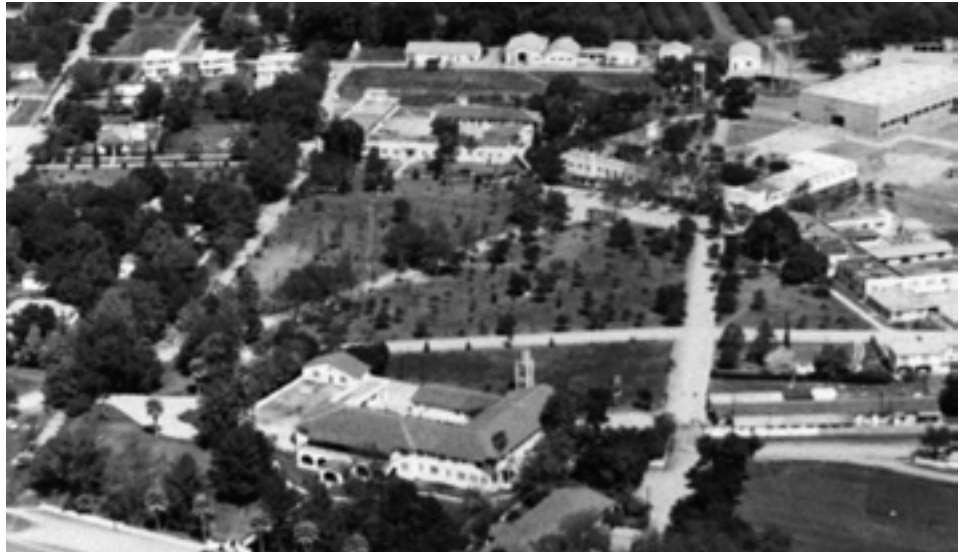
Campus da Universidad de Montemorelos, no México, cerca de 1977.

1958 A Associação Geral aprova a união da Potomac University e do Emmanuel Missionary College em Berrien Springs, Michigan. O novo nome, Andrews University, é escolhido dois anos