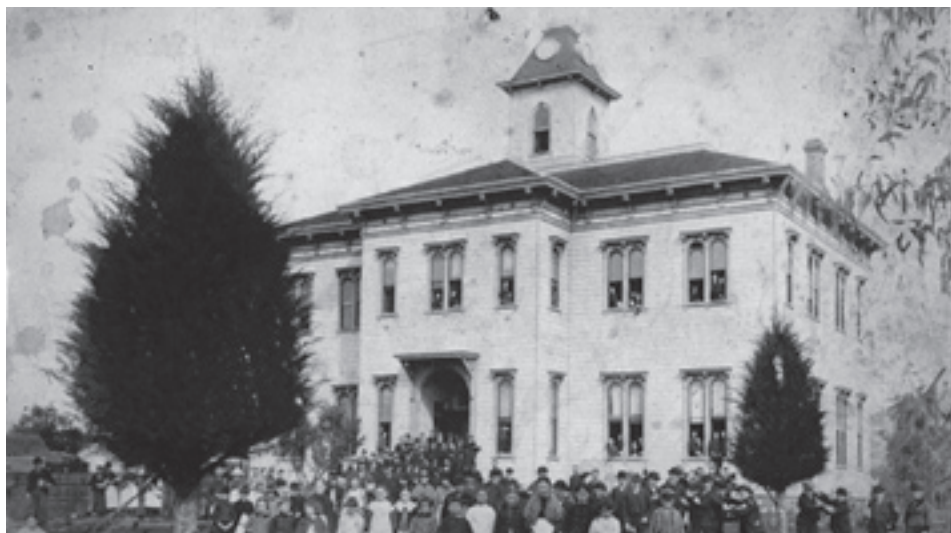
Uma das primeiras fotos do Healdsburg College, estabelecido em Healdsburg, Califórnia, em 1882. O nome foi mudado para Pacific Union College em 1906 e, três anos depois, a instituição mudou-se para a propriedade onde está localizada atualmente, em Angwin, a poucos quilômetros de distância do local original.

para os habitantes das ilhas do Pacífico.