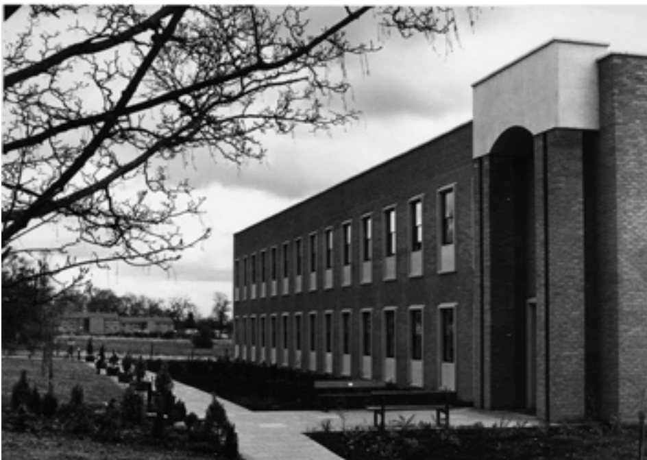
Prédio do Seminário em Newbold College, na Inglaterra, ao redor de 1983.