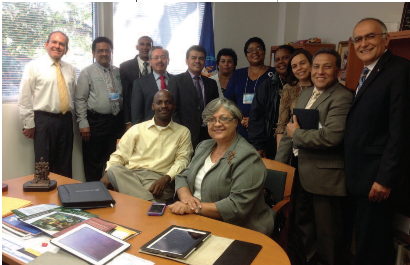
Reitores universitários que participaram do Concílio sobre Educação Bilingue, patrocinado pelo Departamento de Educação em 2013.

Por sugestão do Departamento de Educação da DIA, a comissão da Divisão votou acrescentar ao Manual de Batismo um estudo bíblico sobre a educação cristã, com o propósito de ajudar os novos convertidos a compreenderem o seu valor.