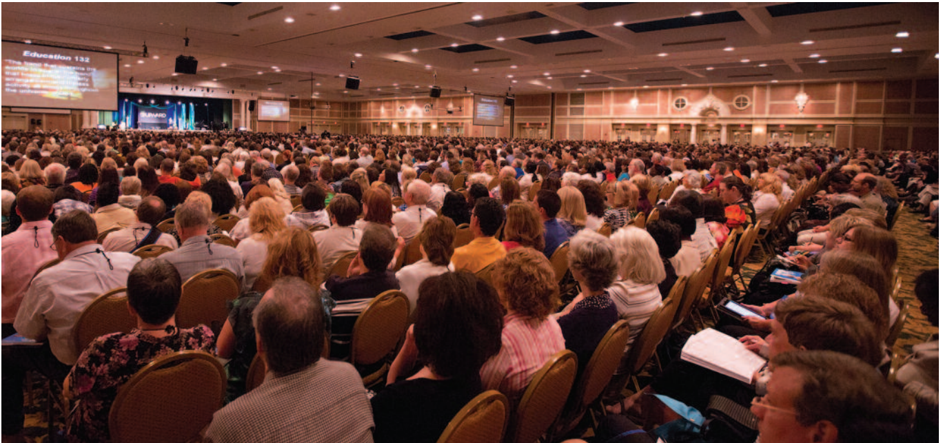
Em agosto de 2012, 6.500 educadores participaram do congresso realizado pela DNA em Nashville, no Tennessee

fundiram. Uma nova escola de educação a distância foi formada e, atualmente, mais de 3.000 alunos se beneficiam do ensino a distância para obter os diplomas e créditos da Universidade Andrews. Embora a Universidade Griggs tenha se integrado à Universidade Andrews, ela ainda é reconhecida como tendo um dos melhores programas de educação a distância nos EUA.