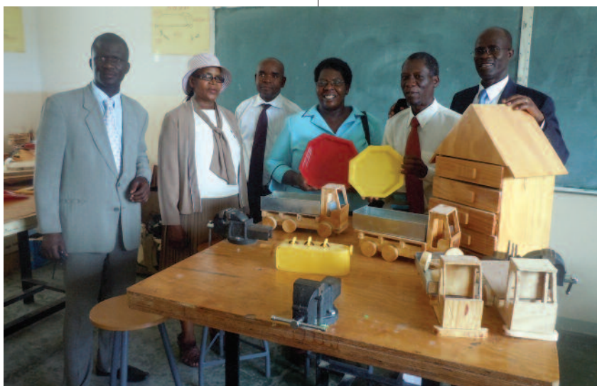
Pratos plásticos e brinquedos de madeira feitos em aulas práticas pelos alunos do Eastern Gate Academy, em Botsuana.

A DSOI e suas Uniões e instituições continuam a fornecer bolsas de estudo para professores e administradores que fazem pós-graduação. A cada ano, a DSOI patrocina cerca de 200 funcionários que estudam na Universidade Adventista da África, (Quênia), na Faculdade de Helderberg (África do Sul) e em outras instituições dentro da Divisão. A Associação Geral também tem concedido bolsas de estudo para alunos