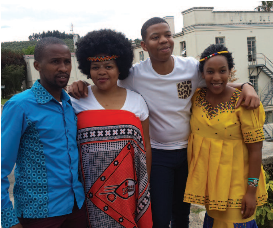
Comemoração do "Dia da Herança", 24 de setembro, no Helderberg College, África do Sul.

• Dia da Herança, África do Sul – O Colégio Helderberg celebra sua diversidade, todos os anos, em 24 de setembro – o Dia da Herança. Os alunos, professores e convidados assistem e participam de uma celebração cheia de cores, música, poesia e histórias que representam suas diferentes origens culturais. Essa celebração é seguida de uma feira