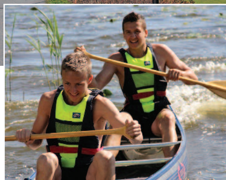
À Direita: Alunos do Colégio fazendo canoagem.

para os professores de educação religiosa do ensino médio. Motivados e comprometidos, eles assistem às aulas intensivas durante um final de semana por mês e cumprem as exigências por correspondência, a fim de obterem o seu diploma.