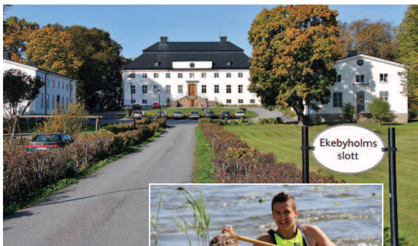
Acima: Junior College (Ekebyholmsskolan), Rimbo, na Suécia (para alunos do Ensino Fundamental II).

Na Croácia, Hungria, Polônia e Sérvia, um excelente trabalho tem sido realizado com as aulas nos finais de semana e treinamentos por correspondência