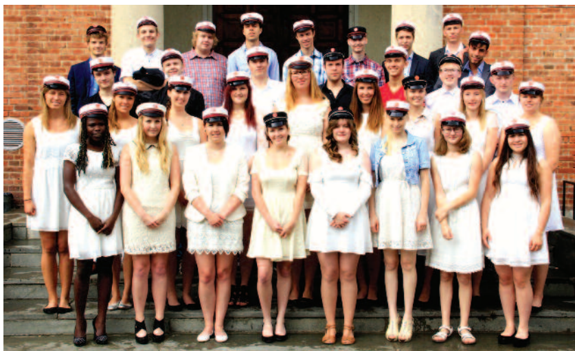
Grupo de formandos do Ensino Fundamental II, em 2015, no Colégio Adventista de Vejle-fjordskolen, na Dinamarca.

cendo uma variedade de cursos de capacitação e eventos de treinamento, como por exemplo, as convenções educacionais regionais e as programadas pela Divisão. Três convenções europeias interdivisão, bianuais, para professores de teologia, foram realizadas durante este quinquênio: em Cernica, na Romênia; em Beirute, no Líbano; e em Bracknell, Berkshire, na Inglaterra. Cada uma delas forneceu incentivos significativos, oportunidades de inter-relacionamentos e desenvolvimento profissional aos participantes, não só da DTE, mas também da Divisão Intereuropeia (DIE) e da Euroasiática (DES). As três Divisões europeias se uniram para a realização desses eventos.