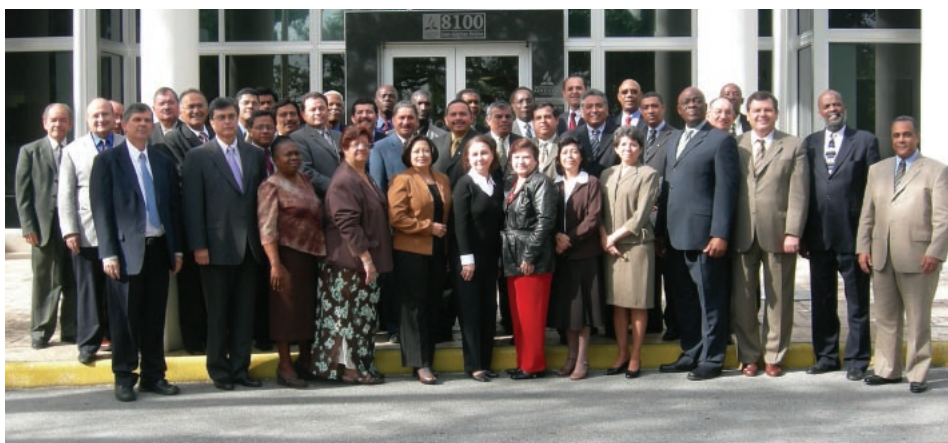
Directivos en la sede central de la División Interamericana.

Uno de los logros de la segunda cumbre de educación de la DIA fue delegar la acreditación de las escuelas primarias