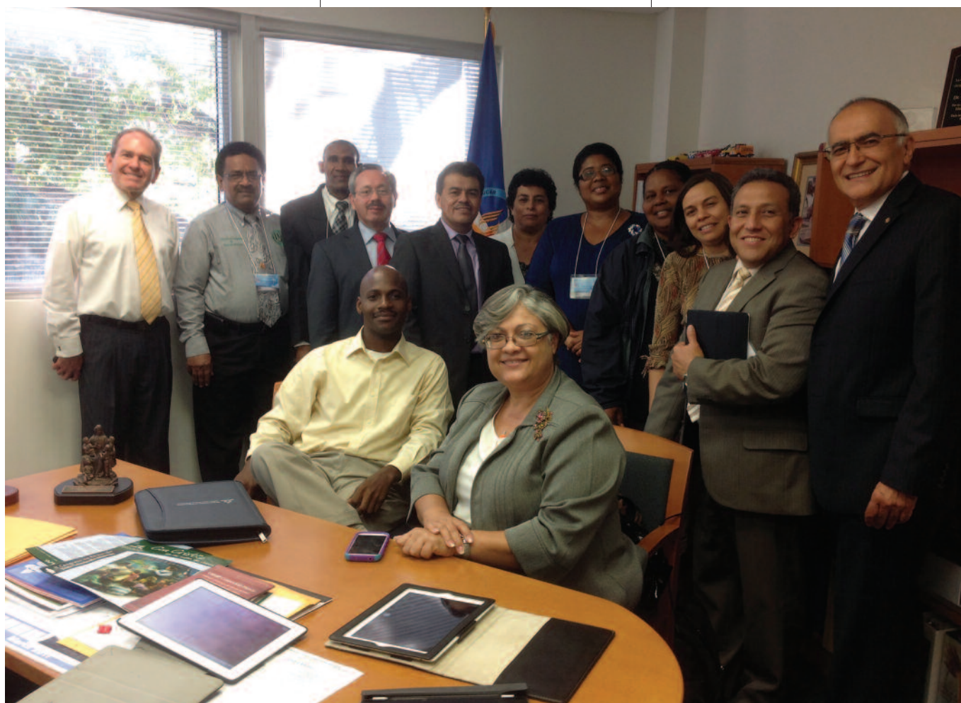
Los responsables de educación universitaria que participaron del Consejo sobre Educación Bilingüe, patrocinado por el Departamento de Educación en 2013.

En septiembre de 2014, se llevó a cabo el II Congreso de Educación del territorio bajo el lema “El maestro: Ministro del evangelio”. Concurrieron al evento 1020 delegados –maestros de