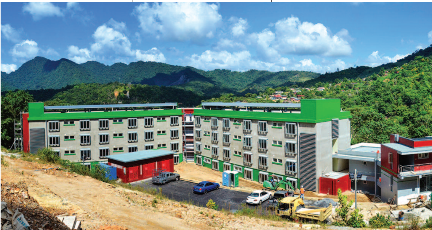
Construcción del edificio Greaves que servirá como residencia de varones en el campus de la Universidad del Sur del Caribe (Trinidad y Tobago).

Varias universidades del territorio han reconocido la necesidad de establecer extensiones para ofrecer educación denominacional a estudiantes que no puedan asistir al campus principal de la